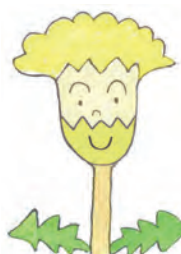
ほっそりスマート カンサイタンポポ 里山がだいすき さとやま