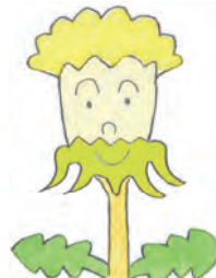
おひげじまんの セイヨウタンポポ 都会がだいすき とかい

おひげにみえるのは、「そうほうがいへん(総苞外片)」 といひます。この形でたんぽぽの見分けができます。