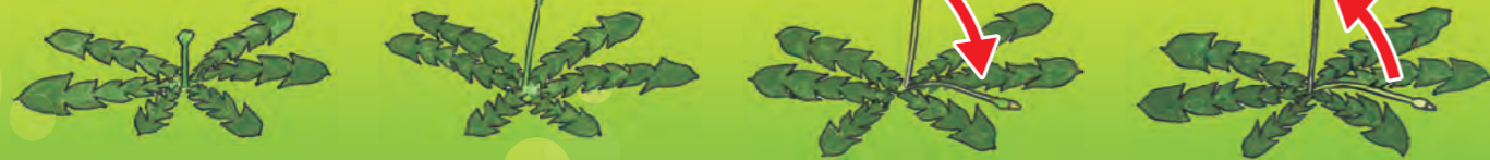
※タンポポの変化はイメージです。見ている間に伸びてゆくわけではありません。